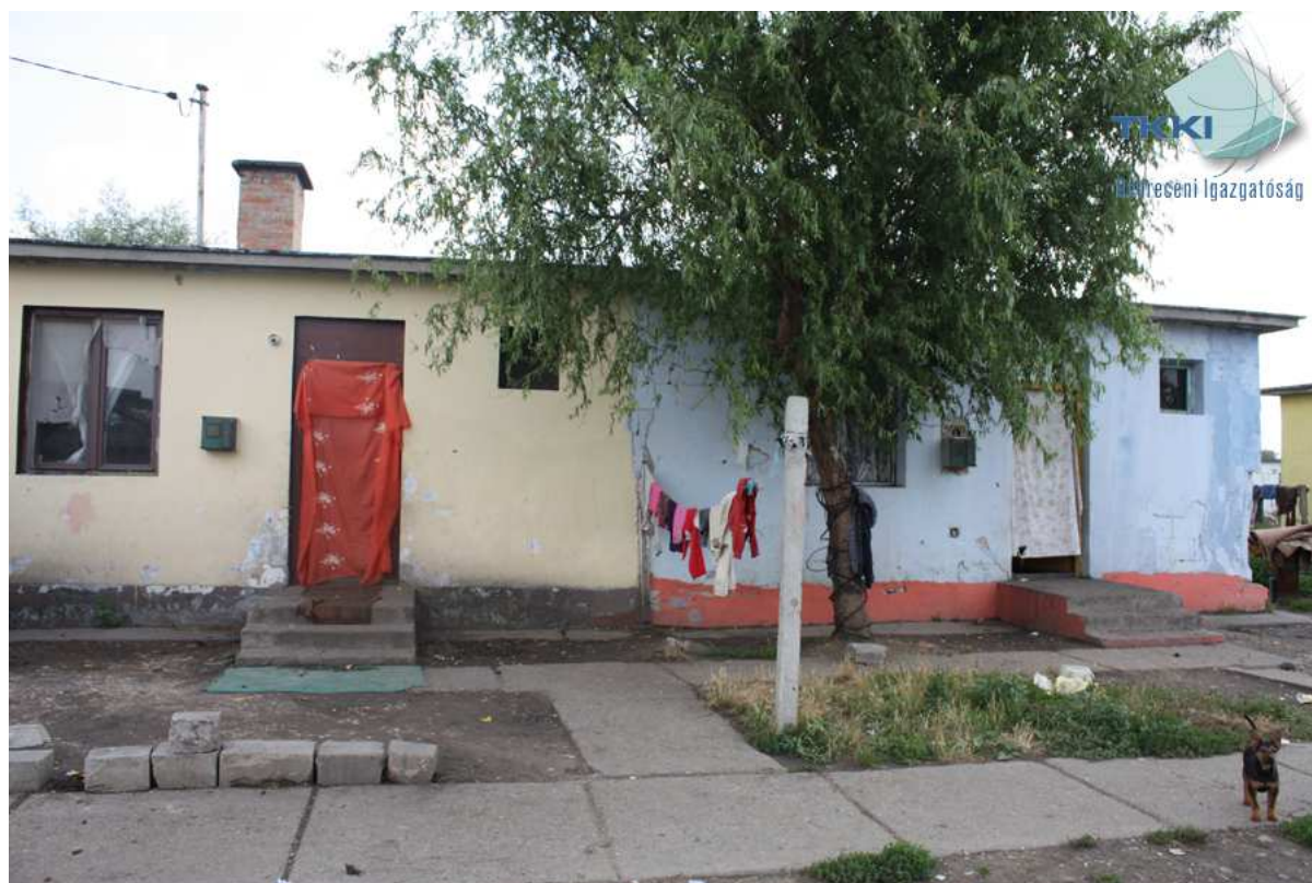
2. ábra: a Törteli – Motor utcai telep egyik jellemző épülete

közterületen végzik. A nevelési, oktatási intézmények, az alapvető élelmiszereket árusító bolt, posta, könyvtár, közösségi ház nehezen megközelíthetőek, csakúgy, mint a közösségi közlekedés megállóhelyei.