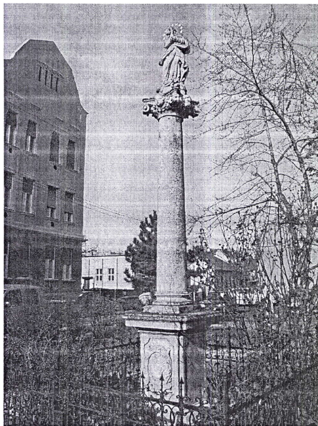
3. sz. Nepomuki Szt. János szobor