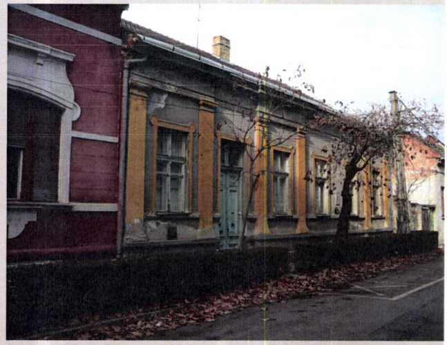
61. Madách Imre utca 49.