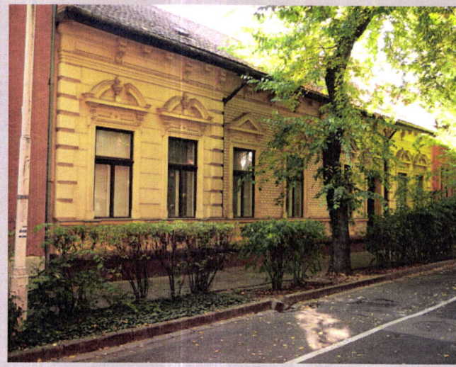
62. Mária utca 5.