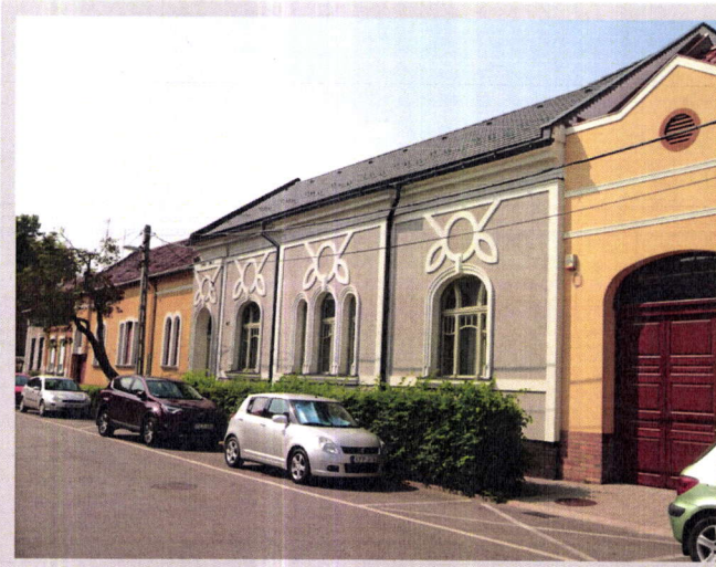
60. Madách Imre utca 43.